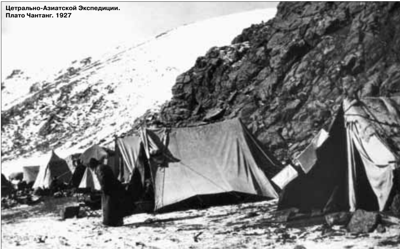
Центрально-Азиатской Экспедиции. Плато Чантанг. 1927