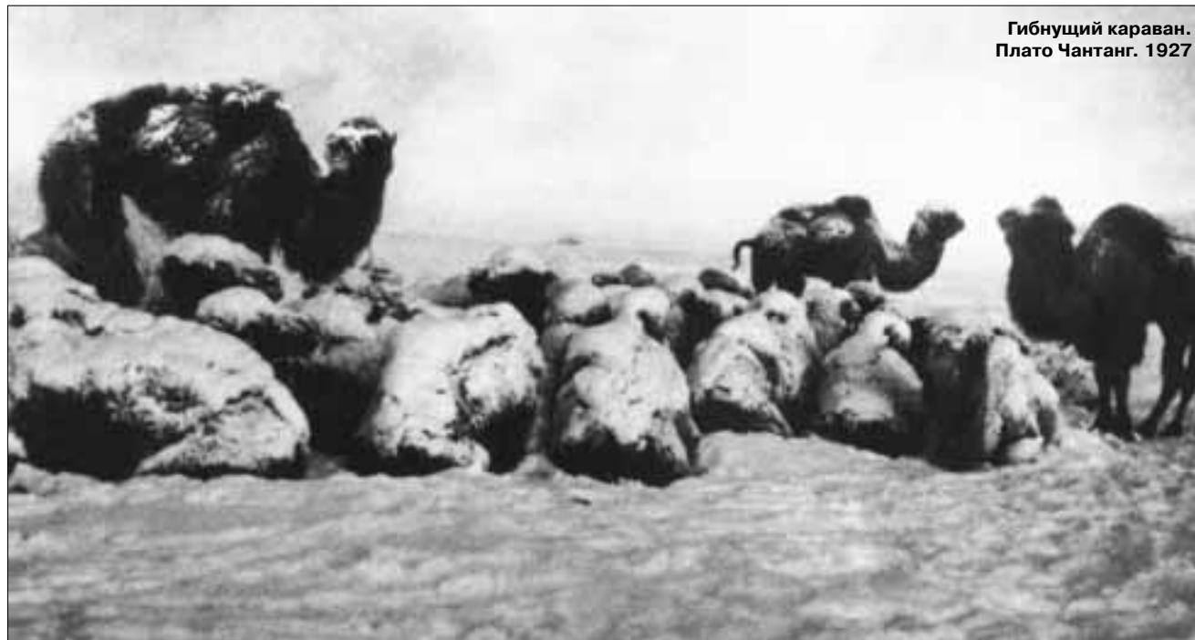
Гибнущий караван. Плато Чантанг. 1927

О. Шишкин еще в 1994 году в своей статье приводил документ армии разведки: «Фактически возвращение Панчен-ламы в Тибет <...> возможно, однако лишь в результате военного похода» 13 . В свое время в геополитических стратегиях советского ру-