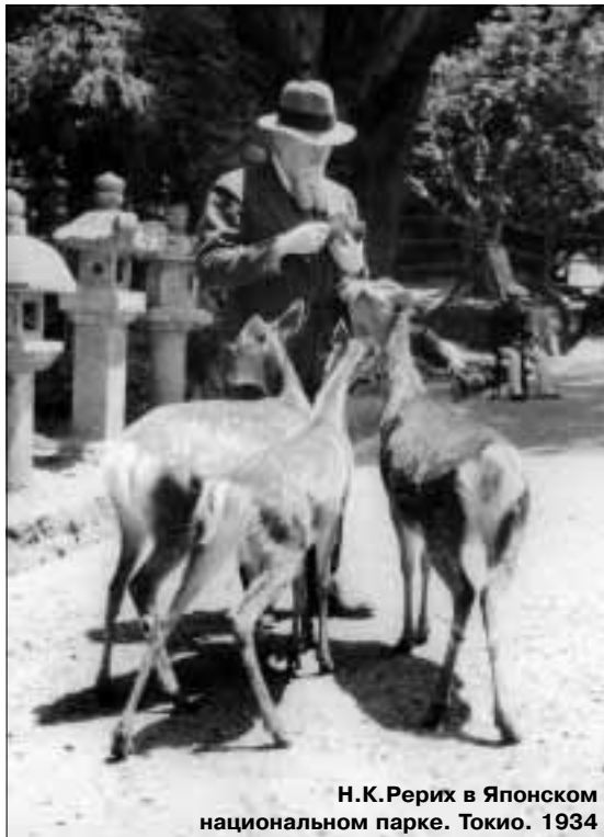
Н.К. Рерих в Японском национальном парке. Токио. 1934