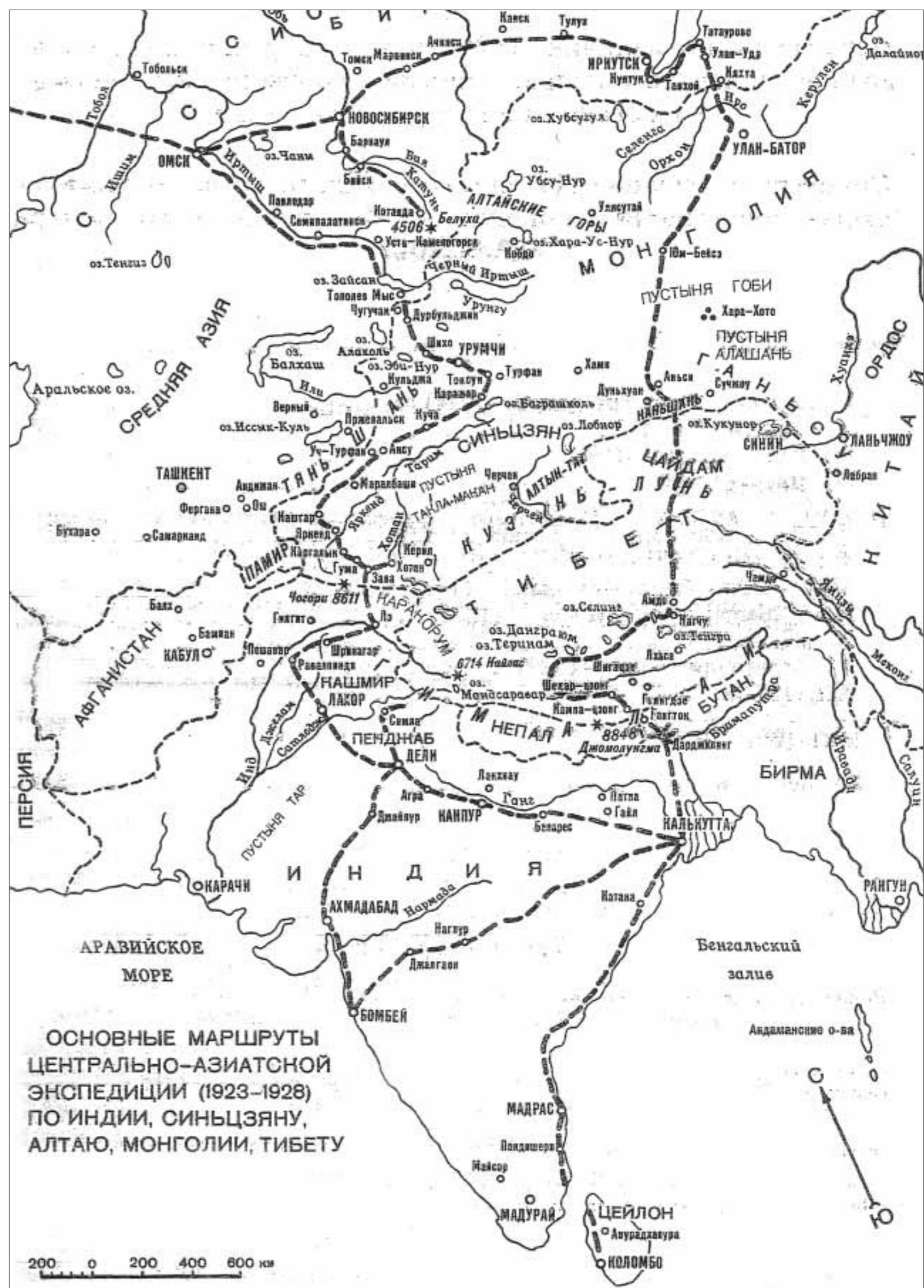
ОСНОВНЫЕ МАРШРУТЫ ЦЕНТРАЛЬНО-АЗИАТСКОЙ ЭКСПЕДИЦИИ (1923—1928) ПО ИНДИИ, СИНЬЦЗЯНУ, АЛТАЮ, МОНГОЛИИ, ТИБЕТУ

Истинное положение вещей, о котором сообщил Н.К. Рерих Уоллесу, для министра сельского хозяйства было уже не столь важно, так как в это время он был занят укреплением своих личных позиций. Сам Н.К. Рерих спустя почти год