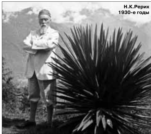
Н.К. Рерих 1930-е годы

Создается впечатление, что автор часто домысливает за Рериха его планы и прогнозы. Так, в двух лаконичных фразах из дневника Рериха начала 20-х годов (а именно: «Кто поймет Великий план?» и «Союз народов Востока назревает») ему видится зарождение идеи «Новой