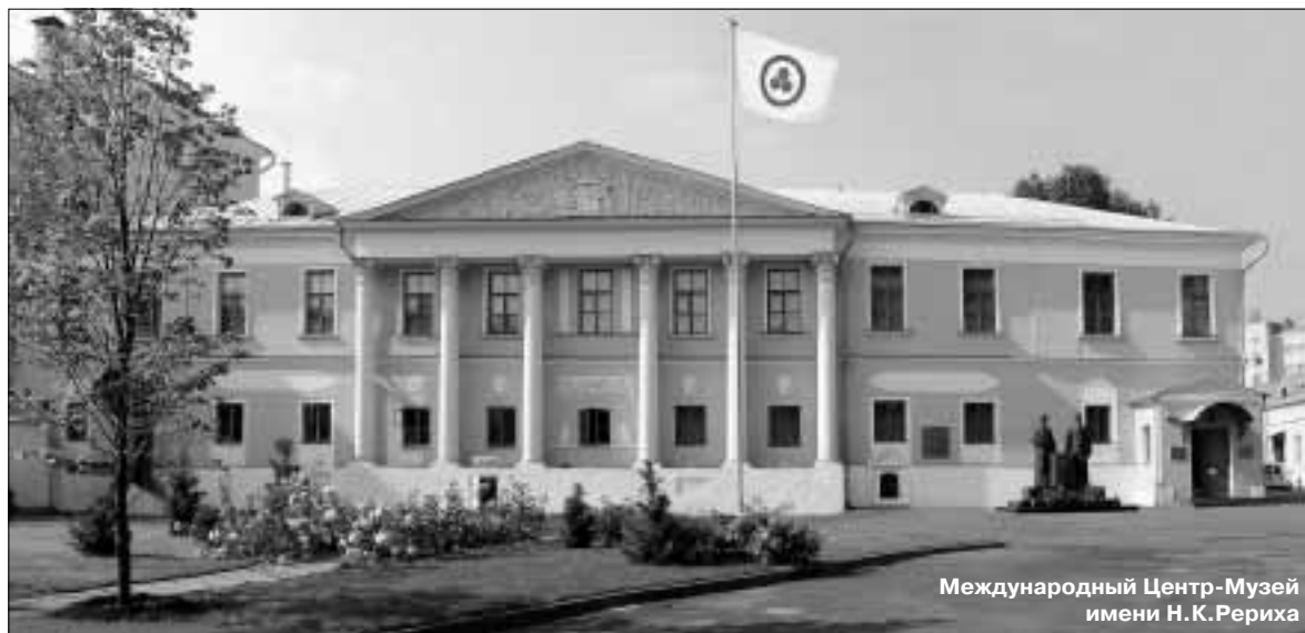
Международный Центр-Музей имени Н.К. Рериха