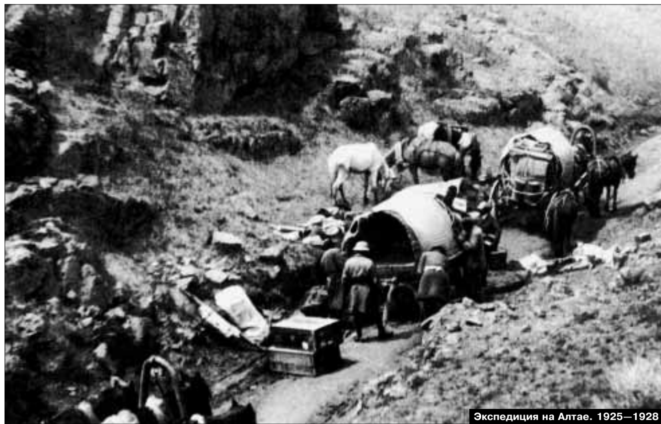
Экспедиция на Алтае. 1925—1928