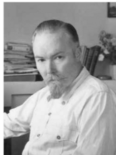
Юрий Николаевич Рерих (1902–1960)