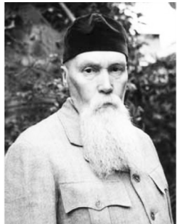
Николай Константинович Рерих (1874–1947)