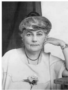
Елена Ивановна Рерих (1879–1955)