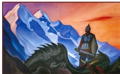
Н.К. Рерих. Победа. 1942 г.

В Москве готовится выставка "Победа". Честь художникам, запечатлевшим победу великого Народа Русского! В героическом реализме отобразятся подвиги победоносного воинства. Будет создано особое хранилище этих великих памятков. От вождя до безвестного героя во благо будущих поколений будет запечатлен героизм защитников Родины.