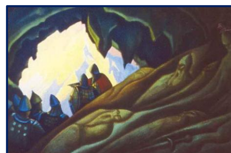
Н.К. Рерих. Богатыри проснулись. 1940 г.

Русское художество, избежав всякого фюмизма и блеффизма, идет широкой здоровой стезею героического реализма. От этого торного пути много тропинок ко всем народам, возлюбившим народное достояние. Сняты ржавые замки. Выросло дружное желание сотрудничества.