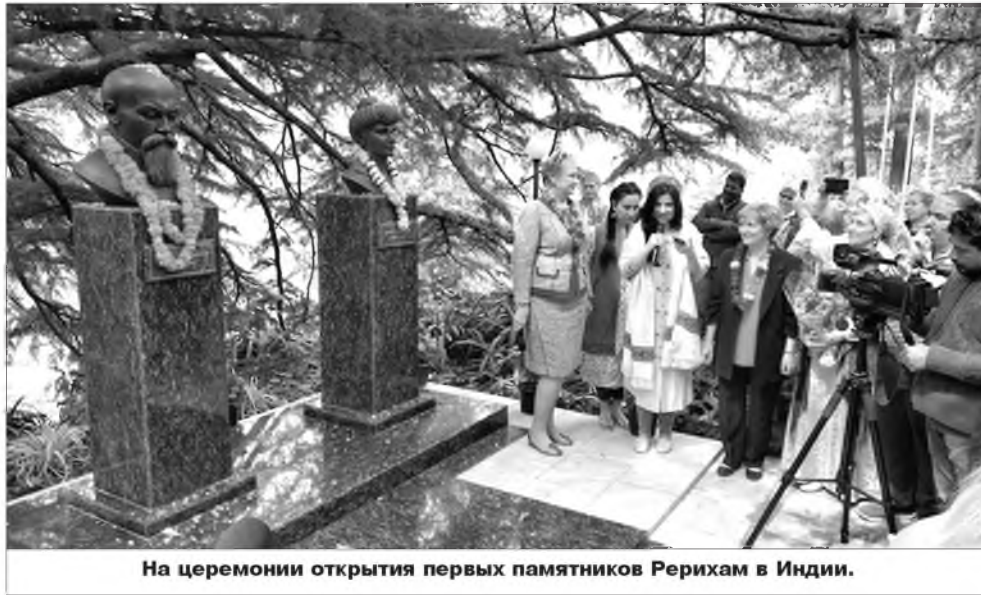
На церемонии открытия первых памятников Рерихам в Индии.

В знак нерушимой дружбы между Индией и Россией индийский и российский кураторы