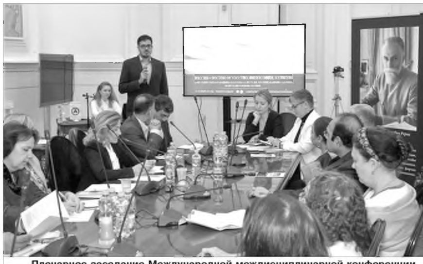
Пленарное заседание Международной междисциплинарной конференции «Россия – Восток: искусство, философия, культура».

Энергетика наследия Рерихов работает на благо России. Но сейчас, после событий 2017 года, когда Государственным музеем Востока при поддержке Министерства культуры РФ был осуществлен захват общественного Музея имени Н.К. Рериха в усадьбе Лопухиных, наследие особо нуждается в защите его материальной ос-