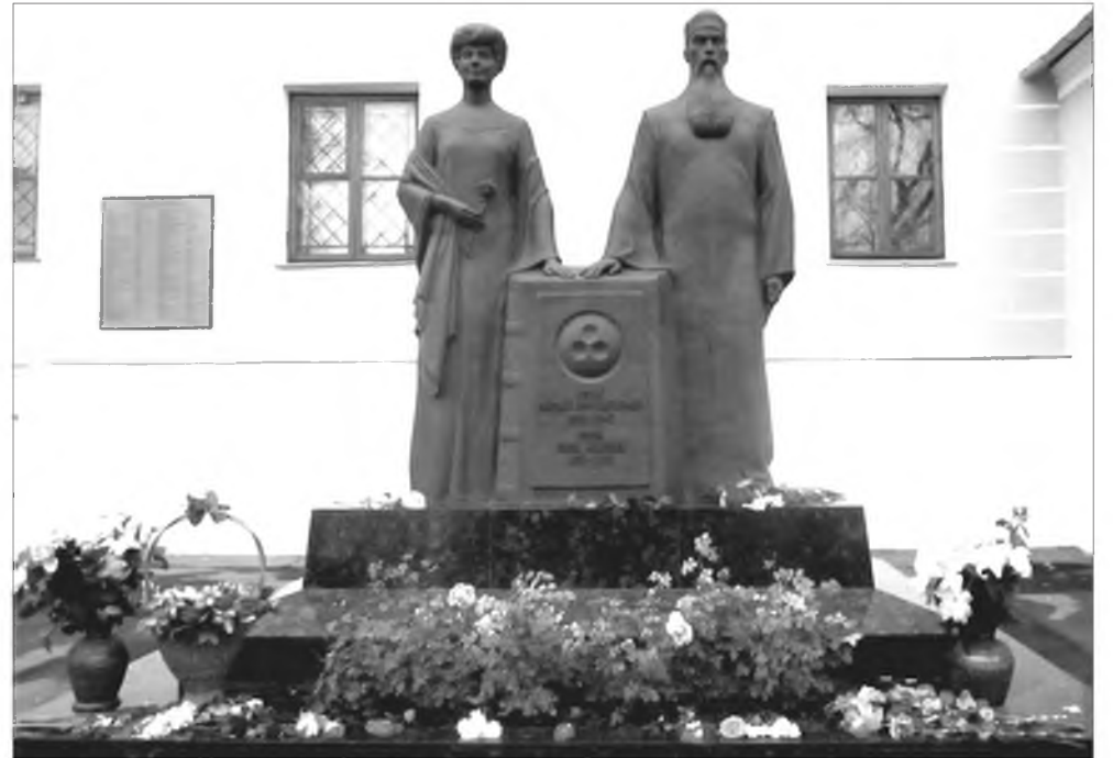
Мемориал Елены Ивановны и Николая Константиновича Рерихов в усадьбе Лопухиных в Москве.

Стыда за страну, которая, к сожалению, почти всегда так несправедливо обращается со своими великими людьми. Самой большой проблемой России Елена Ивановна Рерих считала «удушение мысли». Именно это обстоятельство становилось причиной преследования великих людей, которое для многих из них закончилось трагически. Достаточно вспомнить священника Павла Флоренского, Осипа Мандельштама, Всеволода Мейерхольда, а сколько философов, ученых, писателей и поэтов эмигрировало из России! Но история, как видно, ничему не учит, и намерение снести памятники Рерихам тому горький пример.