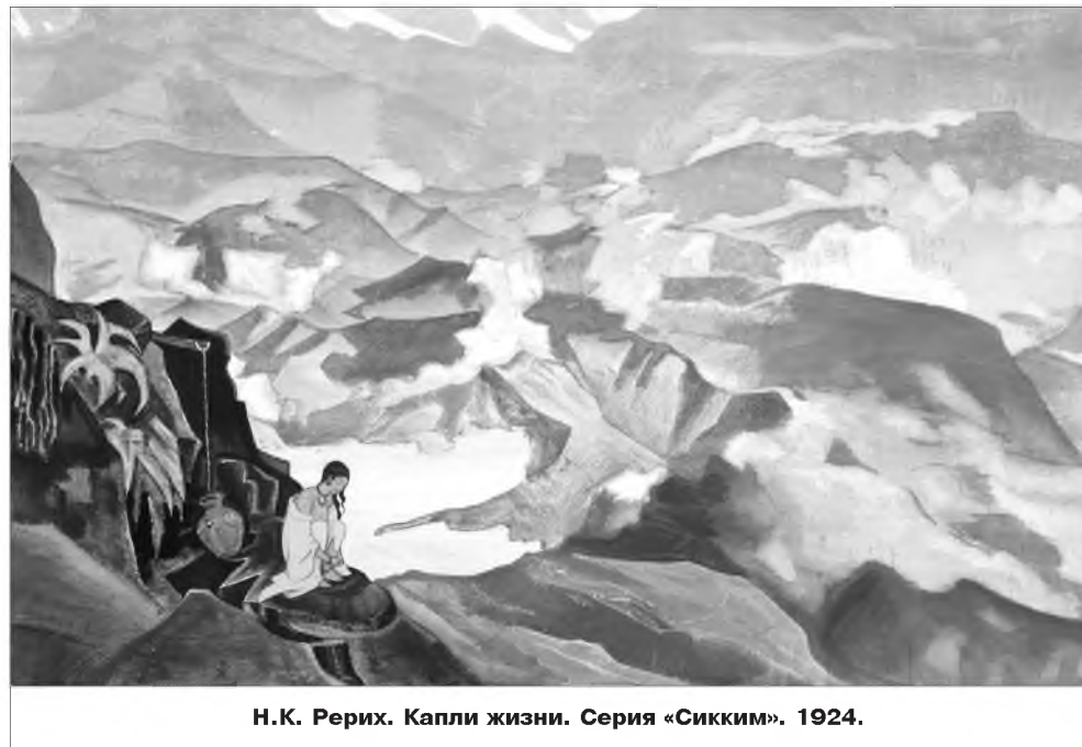
Н.К. Рерих. Капли жизни. Серия «Сикким». 1924.

(Июнь 10). Все живое живет и питается за счет живого. Одна форма пожирает другую. Все формы уничтожаются смертью, чтобы искра, или сущность, ее одушевляющая, облеклась в новую форму, более совершенную. Эволюция совершенно не считается с формами жизни, которые она порождает, постоянно заменяя их новыми. Личность человека – это тоже форма, в которой заключено ее содержание, то есть сущность, дающая личности возможность проявления. Эволюция совершенно не считается также и с личностью человека, уничтожая эти формы миллиардами заодно с физическим телом. Отдельной личности нет места в схеме эволюции жизни,