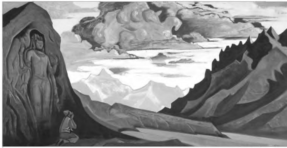
Н.К. Рерих. Майтрейя Победитель. Серия «Майтрейя». 1925.

Развитие сердца, новые научные открытия, подтверждающие основы Учения, и сотрудничество во всем также отличают век Майтрейи от прежней эпохи. «Ведь самая широкая кооперация начертана на знамени эпохи Майтрейи!» – пишет Е.И. Рерих. – «...» Во имя благого сотрудничества для новой ступени совершенно неотложно усвоить зна-