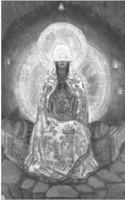
Н.К. Рерих. Матерь Мира. 1924. Фрагмент.