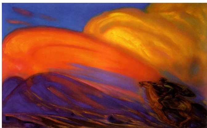
С.Н. Рерих. Вестник. 1947