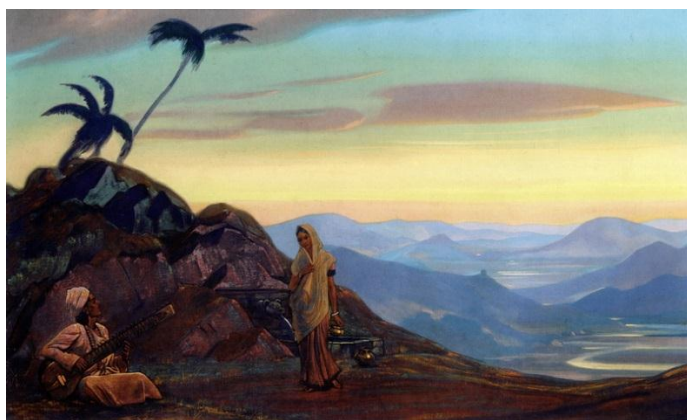
С.Н. Рерих. Индия. 1939

...Святослав Николаевич большую часть своей жизни прожил в Индии. Было ли это для него случайностью? Вряд ли. Именно Индия, ее философия, Красота и утонченность были источником его художественного вдохновения и его творчества в целом. <...> Он был всегда увлечен этой страной, запечатлел ее Красоту на своих полотнах и считал ее второй Родиной. <...>