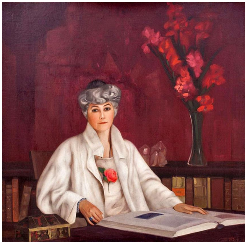
С.Н. Рерих. Портрет Е.И. Рерих

русского философа, писателя, создателя Учения Живой Этики