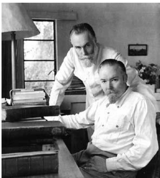
Ю.Н. Рерих и С.Н. Рерих. 1950-е гг.